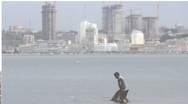
BAIE DE LUANDA À l'image de l'Angola, qui devrait atteindre une croissance de 10% en 2012, l'Afrique montre des signes de décollage économique.