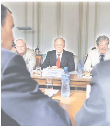
Le conseiller fédéral a-t-il écouté les autorités genevoises? PIERRE ABENSUR

C'est dire si la perspective d'un prochain accord de libre-échange avec l'Inde cette année et, peut-être, avec la Chine en 2012, a ré-