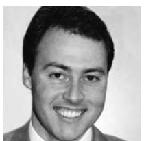
SMK Marco Uehlinger