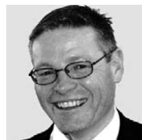
SVIT Suisse centrale Walter Hochreutener