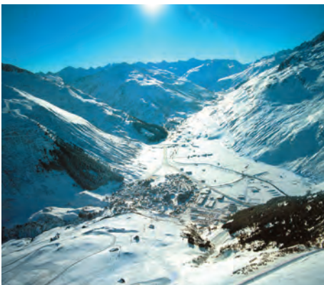
Une vue d'Andermatt (UR)

Emblématiques des années « 00 » du 21 ème siècle, les deux projets immobiliers géants dans les cantons d'Uri et du Valais évoluent dans des directions radicalement différentes.