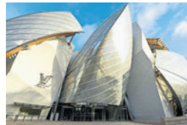
La Fondation Vuitton, située au bois de Boulogne, à Paris.