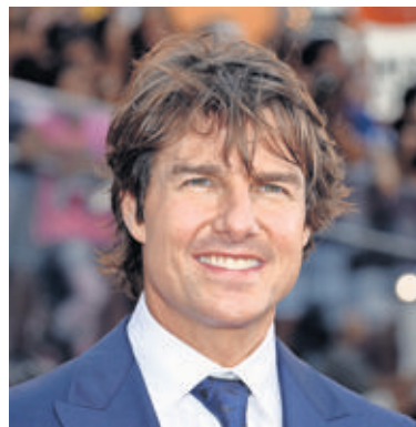
Tom Cruise a déjà vendu plusieurs biens immobiliers avec succès.

Parmi les doués de la pierre, on trouve sans conteste Tom Cruise. Le