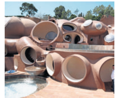
Pierre Cardin possède le Palais Bulles depuis 1991.