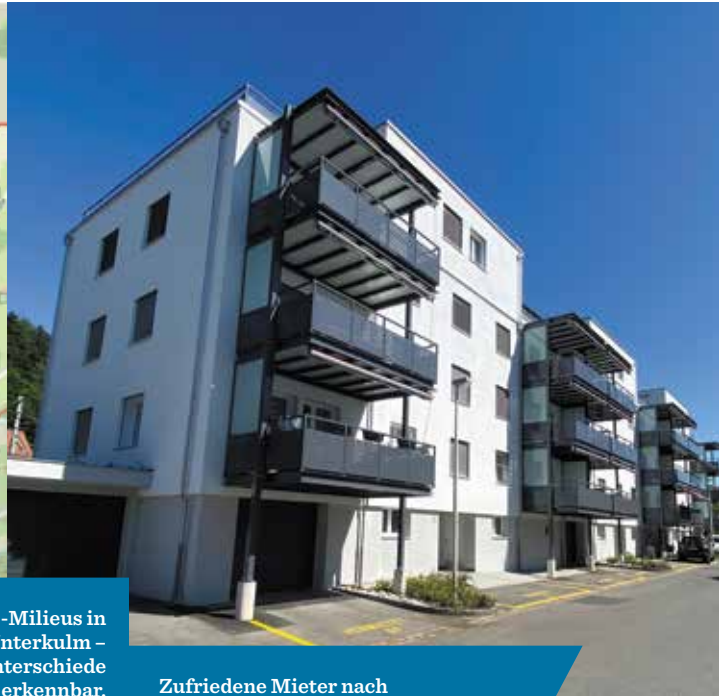
Zufriedene Mieter nach einer Totalsanierung – auch wegen einer sorgfältigen Milieu-Analyse.